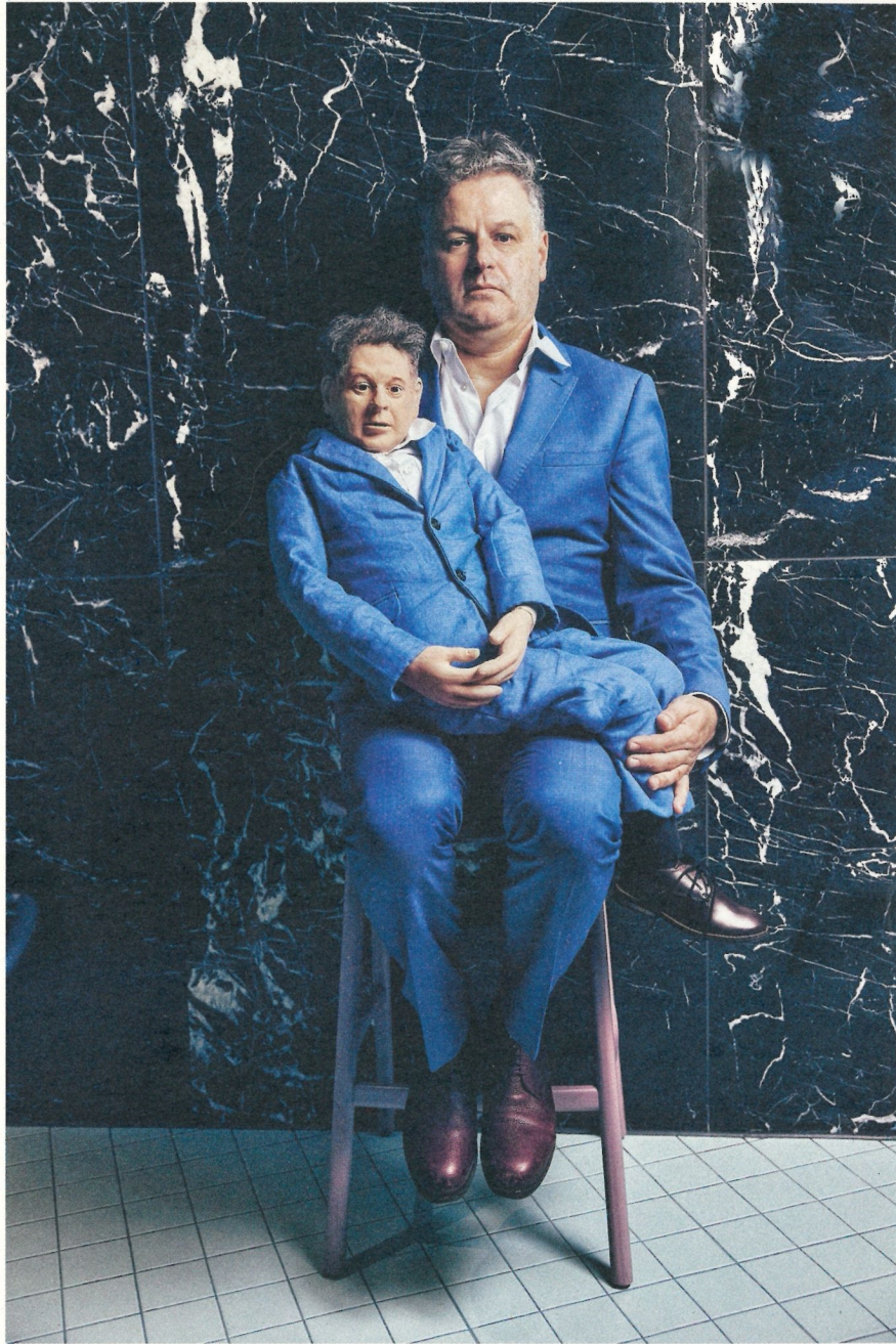
Der Architekt mit der Puppe, 2018, Fotoserie, 25hours Hotel The Circle, Köln